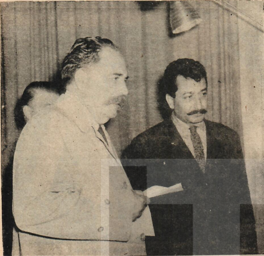
9 Mayıs 1964. Saroyan "Fotoğraflarla Anadolu" sergisinde...