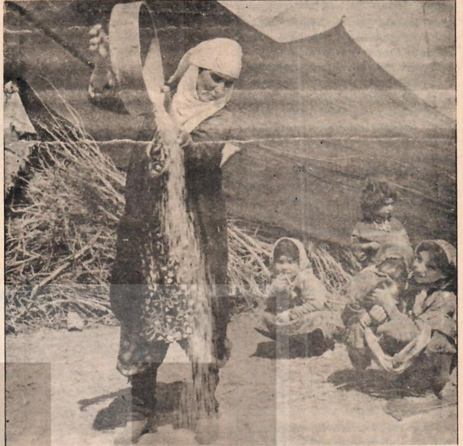
İkibin yılında Avrupa'nın en kalabalık ülkesi olacağız.